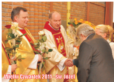
Wielki Czwartek 2011 - św. Józef

Dla nas Polaków po 2005 roku, okres Wielkanocny zawsze już będzie się kojarzył z człowiekiem, który Chrystusa i Jego naukę przyjął na serio, bo w tych właśnie dniach także Jan Paweł II przechodził swoją paschę. Można Go nazwać człowiekiem Wielkiego Czwartku, ponieważ tajemnicę tego dnia nosił w sercu przez całe kapłańskie życie. W październiku 1995 r., Kongregacja ds. Duchowieństwa zorganizowała w Rzymie sympozjum poświę-