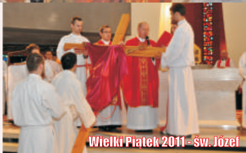
Wielki Piątek 2011 - św. Józef

W liturgii Wielkiego Piątku czytamy teksty, które w niezwykle sposób pozwalają nam się wsłuchać w bijące serce ukrzyżowanego Boga – Człowieka. Pieśń Sługi Pańskiego z Księgi Proroka Izajasza to tekst, który dla Izraela stanowił prawdziwą tajemnicę. W jaki sposób ofiara cierpienia jednego człowieka może doprowadzić do usprawiedliwienia narodu? W jaki sposób człowiek może wziąć na siebie grzechy innych i uleczyć ich poprzez swoje rany? Interpretując ten niezwykle tekst Żydzi widzieli w Słudze Pańskim proroka Jeremiasza, zamordowanego przez rodaków podczas ucieczki do Egiptu, lub samego Izraela cierpiącego prześladowania pośród innych narodów. Trudno jednak w cierpieniach wielkiego proroka i Izraela dostrzec wypełnienie słów Izajasza. W Słudze Pańskiego w zadziwieniu wpatrują się wszystkie narody. To mąż boleści, oswojony z cierpieniem,