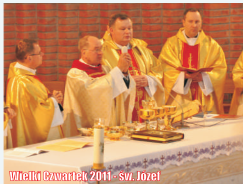
Wielki Czwartek 2011 - św. Józef

Wielki czwartek otwiera Triduum Paschalne – najważniejsze dla Chrześcijanina dni w roku. Wydarzenia tych dni uformowały w najwyższym stopniu wiarę Apostołów, dały treść i formę aby tę wiarę wyrażać przez taką, a nie inną liturgię. Jednak żaden świadek Chrystusa nie urodził się z wiarą „gotową”, ona dojrzewała poprzez łaskę zrozumienia życia, śmierci i zmartwychwstania Chrystusa, a potem przez Wniebowstąpienie i Zesłanie Ducha Świętego.