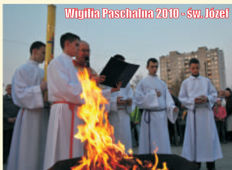
Wigilia Paschalna 2010 - św. Józef

Symbolikę światła i świecy paschalnej, a także znaczenie całej Wielkiej Nocy, tłumaczy nam także Orędzie paschalne śpiewane po wejściu do kościoła i jego oświetleniu: „ Jest to ta sama noc, w której niegdyś ojców naszych, synów Izraela, wywiodłeś z Egiptu i przeprowadziłeś suchą nogą przez Morze Czerwone. Jest to zatem